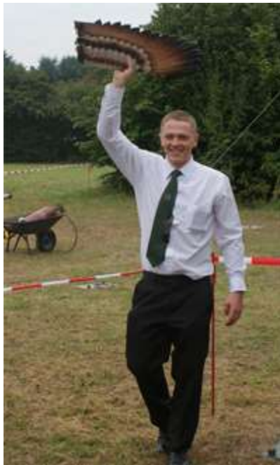
Linker Flügel, 78 weitere Schüsse, Werner Abandonata